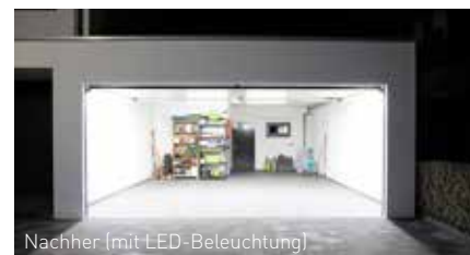
Nachher (mit LED-Beleuchtung)