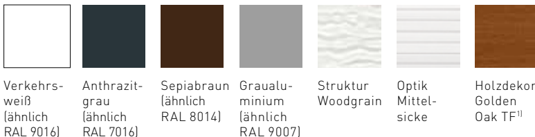
Verkehrsweiß (ähnlich RAL 9016) Anthrazitgrau (ähnlich RAL 7016) Sepiabraun (ähnlich RAL 8014) Graualuminium (ähnlich RAL 9007) Struktur Woodgrain Optik Mittelsicke Holzdekor Golden Oak TF 1)

Wählen Sie Ihr individuelles Design aus attraktiven Farben und Strukturen: