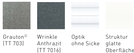
Grauton 2) (TT 703) Wrinkle Anthrazit (TT 7016) Optik ohne Sicke Struktur glatte Oberfläche

Entscheiden Sie sich für eine moderne, glatte Oberfläche ohne Sicke. Auch in Eisenglimmer und Wrinkle Anthrazit erhältlich.